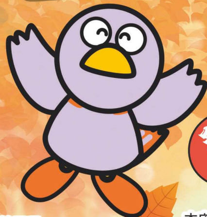
埼玉県 マスコットキャラクター コバトン