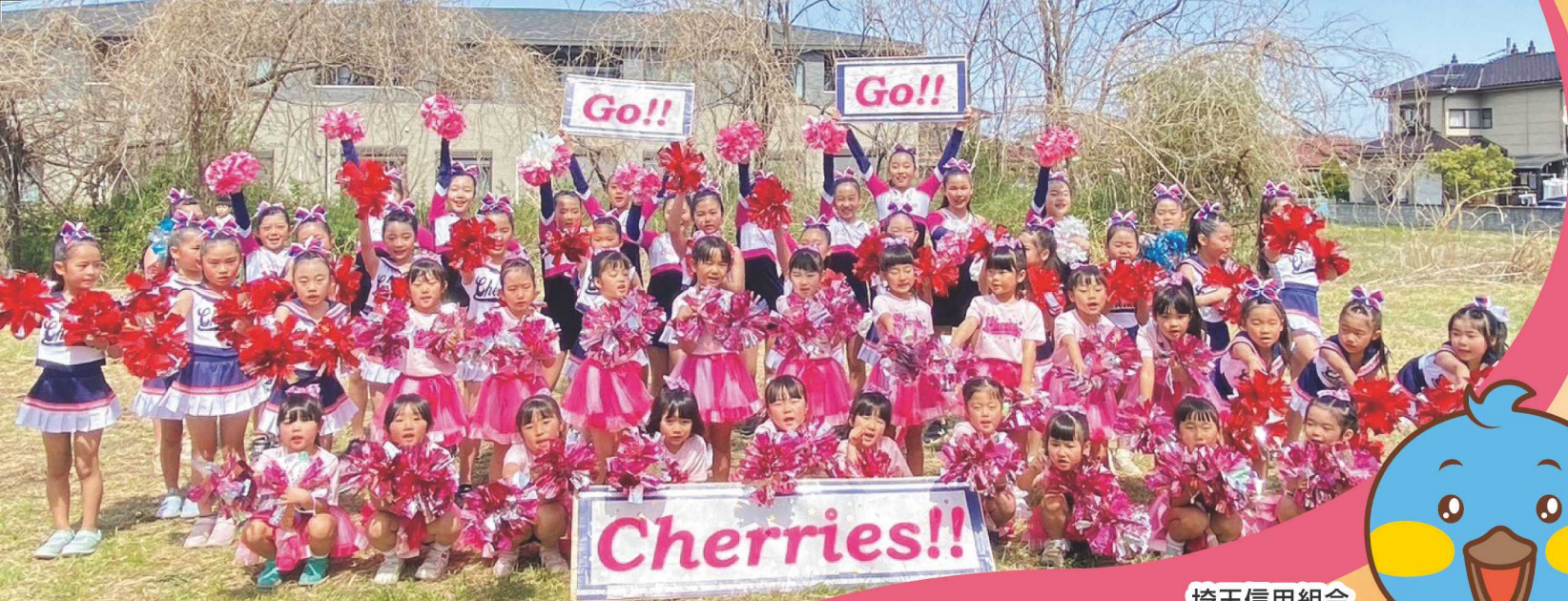
チアダンススクールCherries