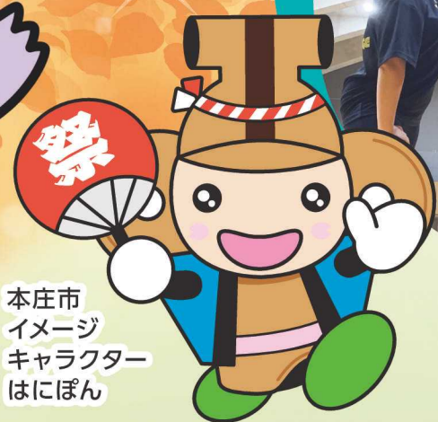
本庄市 イメージ キャラクター はにぼん