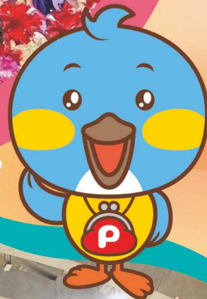
埼玉信用組合 イメージ キャラクター ピッピくん